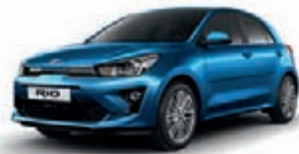
Bathysblau Metallic (SPB)

Bei einigen unserer modernen Metallicfarben werden bewusst unterschiedliche Farbpigmente verwendet. Dadurch können unter bestimmten Lichtverhältnissen, z. B. direktes Sonnenlicht, attraktive Farbeffekte erzielt werden. Zum Teil kann die Farbe changieren, z. B. von Schwarz zu Dunkelblau. Bei den hier abgebildeten Farbdarstellungen kann es aufgrund der Drucktechnik zu Abweichungen zu den Originalfarben kommen. Weitere Informationen zu den Farbeffekten und Grundfarben gibt Ihnen gerne Ihr Kia-Vertrags-händler. Metalliclackierungen sind aufpreispflichtig.