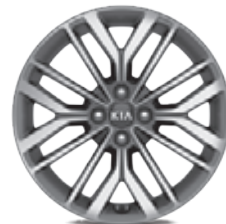
17-Zoll-Leichtmetallfelgen mit Bereifung 205/45 R17 (Serie für GT Line)