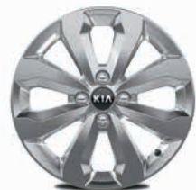
16-Zoll-Leichtmetallfelgen mit Bereifung 195/55 R16 (Serie für Vision und Spirit)