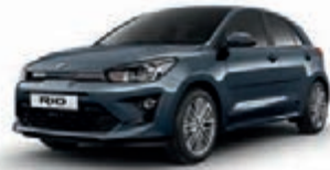
Denimblau Metallic (EU3)*, nicht für GT Line