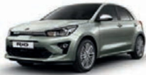
Urbangrün Metallic (URG)*, nicht für GT Line