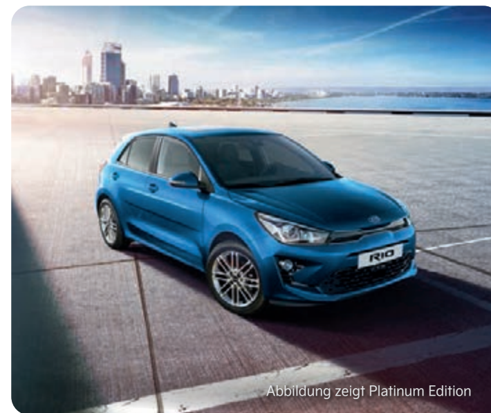
Abbildung zeigt Platinum Edition