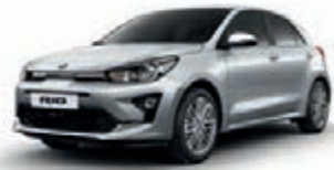
Seidensilber Metallic (4SS)*, nicht für GT Line