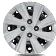
15-Zoll-Stahlfelgen mit Bereifung 185/65 R15 (Serie für Edition 7)