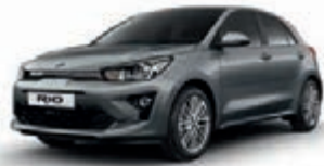
Perennialgrau Metallic (PRG)