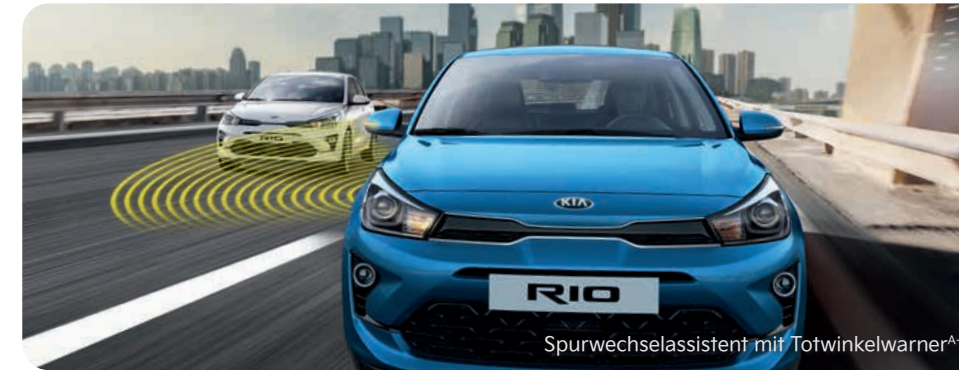
Spurwechselassistent mit Totwinkelwarner A+

Mit einem breiten Spektrum an aktiven Sicherheitssystemen A unterstützt der Kia Rio den Fahrer dabei, in Gefahrensituationen schnell und angemessen zu reagieren. Hier sehen Sie einen Auszug. Ausführliche Informationen zu den Assistenzsystemen erhalten Sie in der Broschüre des Kia Rio unter www.kia.com/de/broschuere .