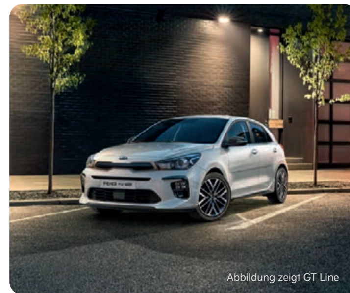
Abbildung zeigt GT Line

Abbildungen zeigen kostenpflichtige Sonderausstattung.