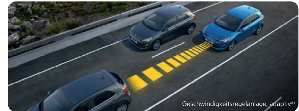
Geschwindigkeitsregelanlage, adaptiv A+

Per Kamera und Radar misst die adaptive Geschwindigkeitsregelanlage (Smart Cruise Control, SCC) die Distanz zum vorausfahrenden Fahrzeug sowie dessen Geschwindigkeit. Wird der festgelegte Sicherheitsabstand unterschritten, bremst das System den Kia Rio ab, wenn nötig bis zum Stillstand. Nur für Doppelkupplungsgetriebe.