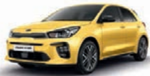
Floridagelb Metallic (MYW), nur für GT Line