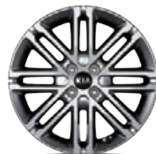
17-Zoll-Leichtmetallfelgen mit Bereifung 205/45 R17 (Serie für Platinum Edition, optional für Spirit)