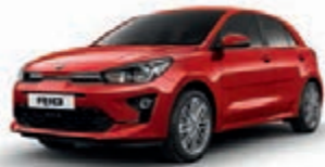
Signalrot Metallic (BEG)